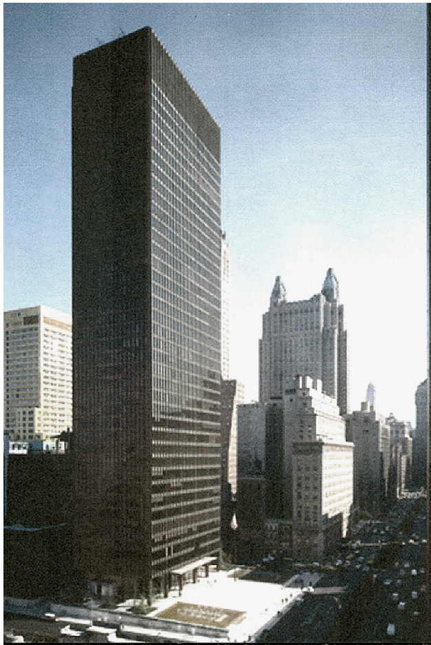
Seagrams Building, 1945 -1958