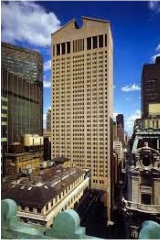
AT&T Building (1982)